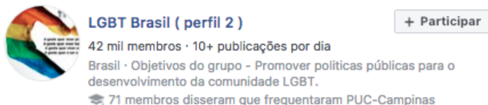
Fig. 4 Descrição resumida do Grupo LGBT Brasil ( perfil 2 ) Facebook. 10 de setembro de 2019

Além disso, o nome dos grupos já pode nos orientar quanto ao objetivo principal da sua abertura, mesmo que cada grupo já possua uma descrição, apresentação e regras descritas pelo administrador. Os filtros nessa pesquisa foram realizados entre janeiro de 2018 a dezembro de 2018.