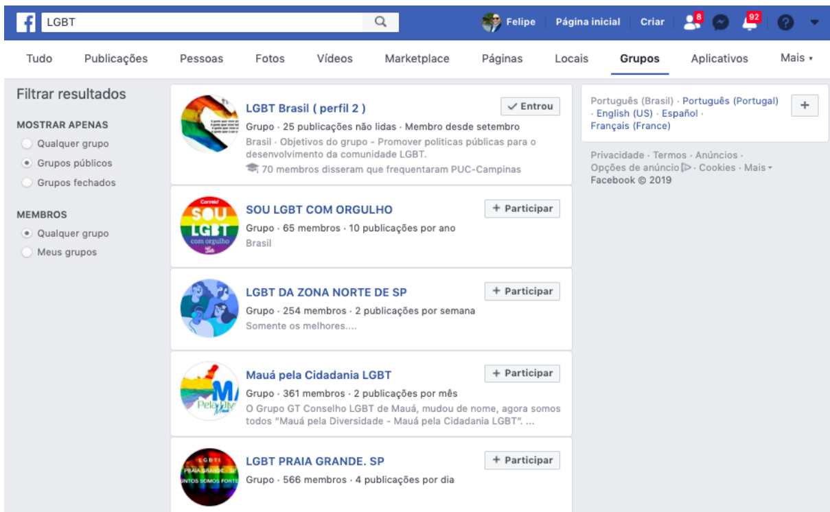
Fig. 3 Filtro Grupos públicos com o termo LGBT Facebook.(10 de setembro de 2019

Além disso, o nome dos grupos já pode nos orientar quanto ao objetivo principal da sua abertura, mesmo que cada grupo já possua uma descrição, apresentação e regras descritas pelo administrador. Os filtros nessa pesquisa foram realizados entre janeiro de 2018 a dezembro de 2018.