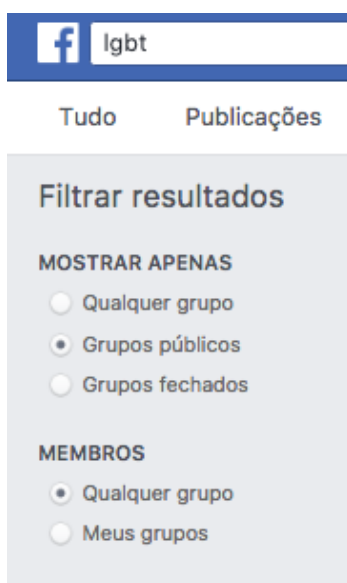
Fig. 1. Filtro dos grupos públicos no Facebook Facebook, setembro de 2018

No contexto da homossexualidade, os grupos LGBTs também se formaram com os mais diversos objetivos, sejam eles para entreter, para o ativismo ou apenas para compartilhar experiências e informações em apoio aos sujeitos homossexuais. Alguns deles também mantêm encontros presenciais e as mais diversas formas de promover a discussão, como é o caso do Grupo Gay da Bahia, que tem configuração em grupo físico 35 , grupo fechado no Facebook 36 , grupo aberto do Facebook e também fanpage , além de páginas em outras plataformas virtuais como o Instagram 37 e Whatsapp .