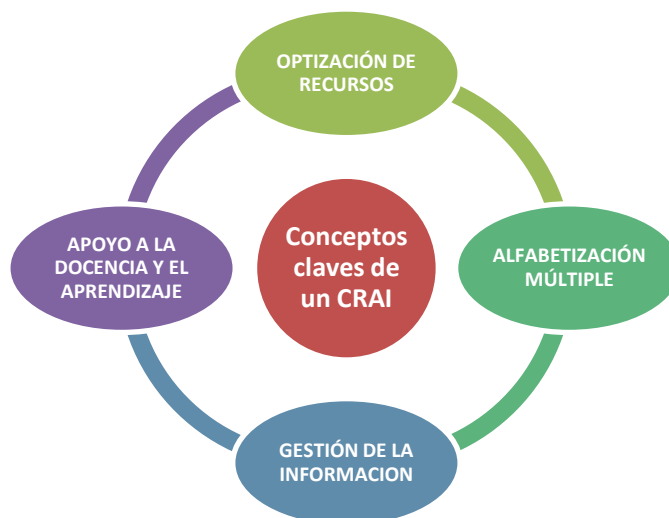
Figura 1 Elementos claves de un CRAI

La optimización de los recursos para Arriola, “Implica que los recursos para el desarrollo de la actividades académicas y de investigación en los estudiantes, docentes e investigadores se conviertan en material electrónico disponible en la web, a través de repositorios organizados y que sea de fácil acceso” 10